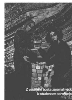
KATEHETSKO PASTORALNA ŠOLA

Obiskuje jo velika večina tistih, ki imajo tudi veliko drugih službenih ali družinskih obveznosti. Mnogi so po obiskovanju teh predavanj potrdili, da jim je šola največ koristila pri vzgoji lastnih otrok ter pri polnejšem preživljanju časa v družini in na delu.