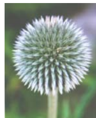
POD TO GORO ČAVENSKO ZBORNIK SE NEŠTE DOLINE