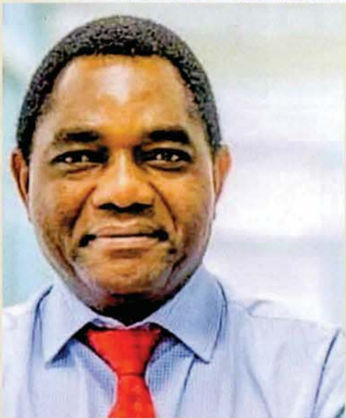
HAKAINDE HICHILEMA predsednik Republike Zambija